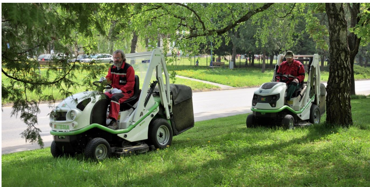
Údržba mestskej zelene