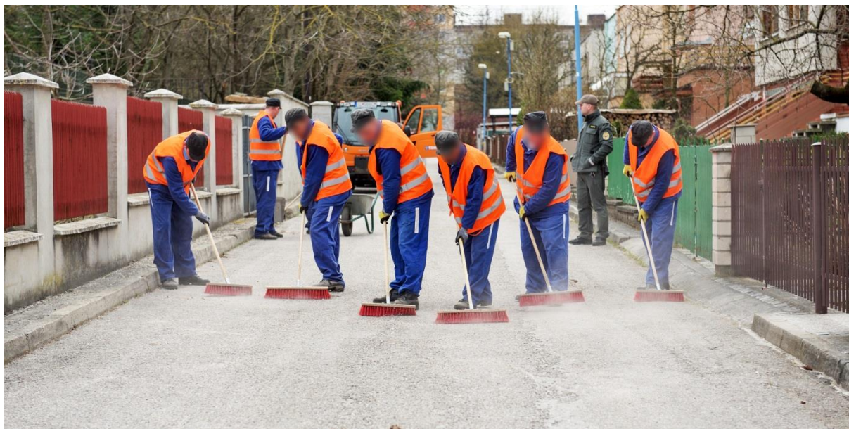
Ručné zametanie odsúdenými na výkon trestu v ÚVTOS Dubnica nad Váhom

Letná údržba - ako sa nazýva, aj keď ide z pohľadu dôležitosti a objemu prác skôr o jarnú a jesennú údržbu komunikácií, zahŕňala v sebe počas roku 2019 vyčistenie najhlavnejších komunikácií mesta Dubnica od inertného posypu aplikovaného počas zimnej údržby.