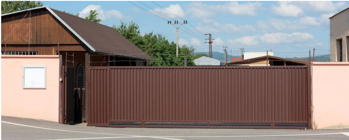
Vstup do areálu nového zberného dvora na Nádražnej ulici

V roku 2019 naša spoločnosť okrem zberného dvora prevádzkovala aj mestské kompostoviská - na ulici Športovcov (objekt bývalej pracovne) a za traťou, v časti oproti Stavoindustrii. Pravidelným prekopávaním kompostovacích kôp sme zabezpečili vytvorenie kvalitného kompostu, ktorý si s obľubou odoberajú obyvatelia mesta pre skultivovanie svojich záhrad. Konáre, ktoré obyvatelia odovzdávali na kompostovisku, sme priebežne odvážali na zhodnotenie.