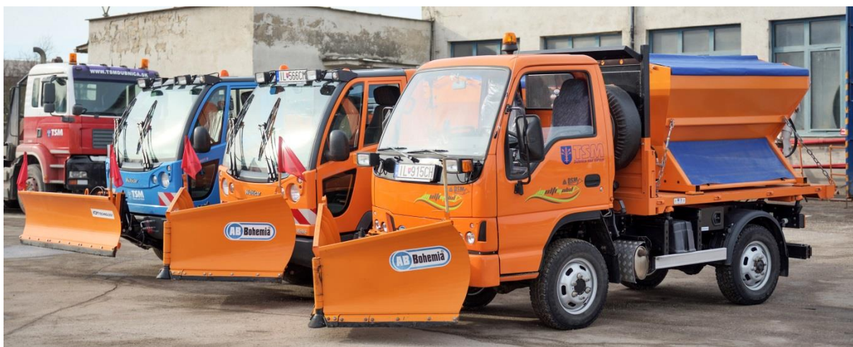
Vozidlá určené na zimnú údržbu komunikácií

Zimná údržba komunikácií patrí medzi najdôležitejšie a zároveň aj medzi technicky a logisticky najnáročnejšie činnosti, ktoré naša spoločnosť vykonáva. Vyžaduje si aj najväčšie nasadenie ľudských zdrojov.