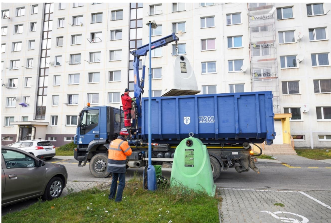
Zber triedeného komunálneho odpadu