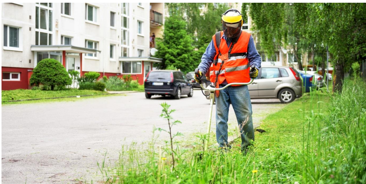
Údržba mestskej zelene