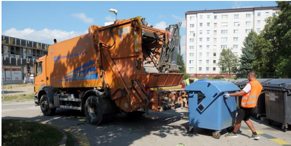
Zber a zvoz triedeného komunálneho odpadu – papiera