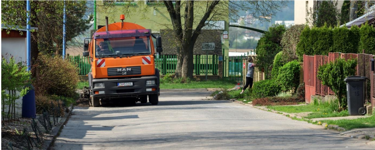
Zametanie cestnej komunikácie externou firmou.

Druhou činnosťou v rámci letnej údržby komunikácií v roku 2019, s prácami vykonávanými priebežne (podľa potreby), bol chemický postrek – odburiňovanie, najmä dláždených chodníkov, krajníc, parkovísk a iných plôch v celom intraviláne mesta Dubnica nad Váhom.